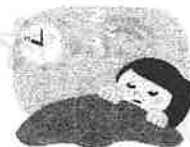
夜ふかしせずに寝る